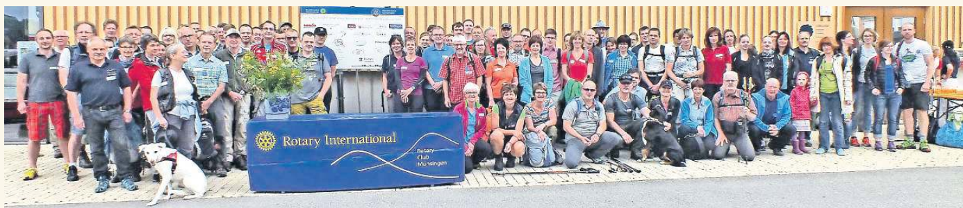
Das Wandern ist der Rotarier Lust – zumindest in Münsingen auf der Schwäbischen Alb: Die 24-Stunden-Wanderung hat 2015 insgesamt 100 Wanderer begeistert und wird es auch dieses Jahr wieder tun.