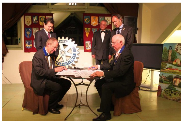
Besiegelung der Partnerschaft